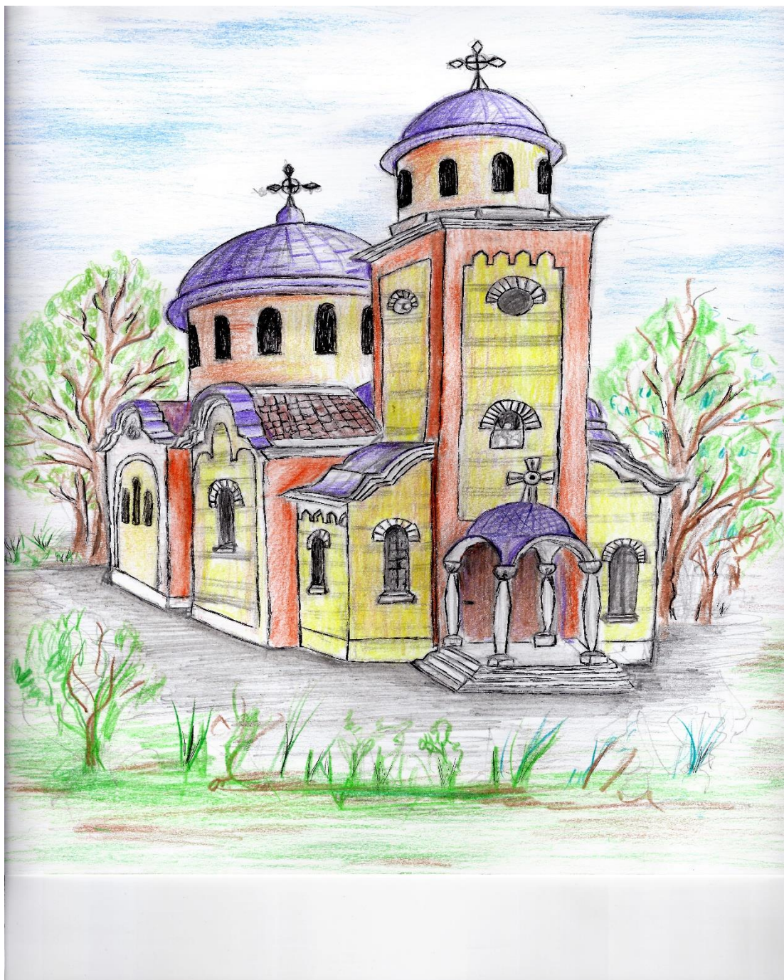
Църква „Св.вмчк. Георги победоносец“, гр. Мездра, дестинация Мездра