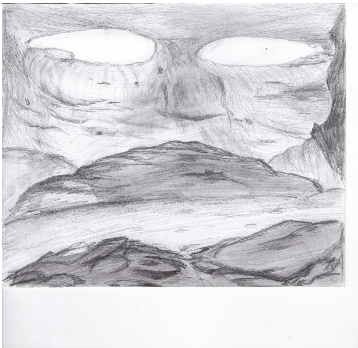
Пещера Проходна – Очите на Бога“, дестинация Луковит