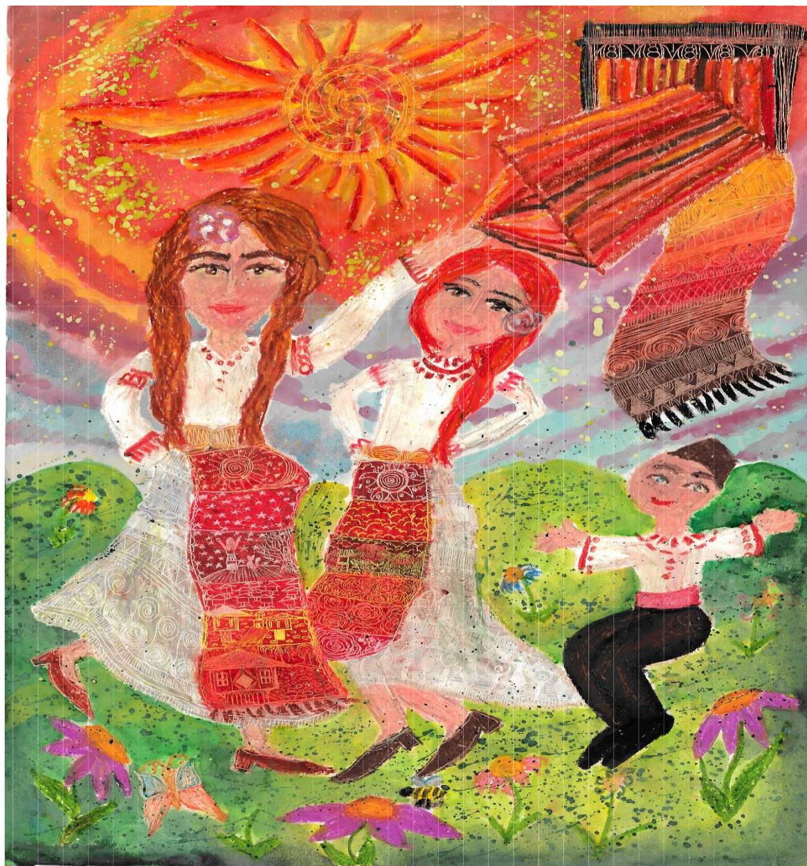
„С България в сърцето – Каварна“, дестинация Каварна