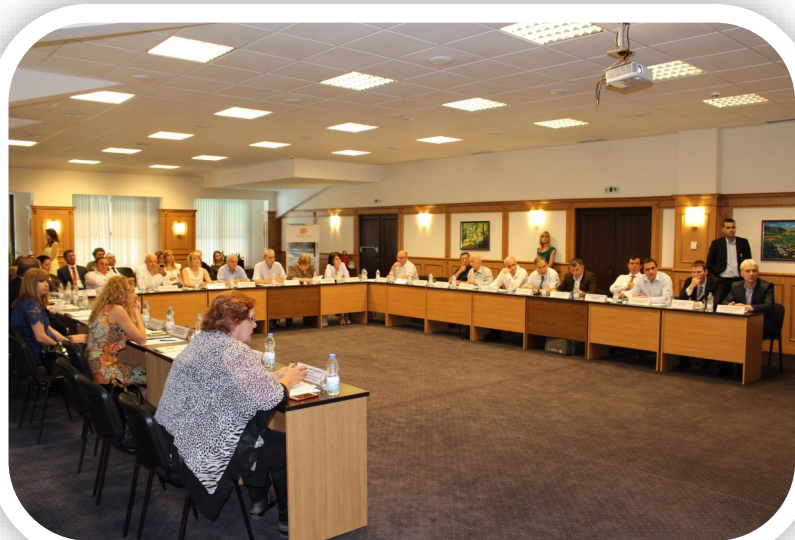
Снимка от заседанието на Националния съвет по туризъм

изпълнява. Това ни позволява да планираме много по-ефективно и правилно маркетинговите си активности", посочи министър Ангелкова. Тя съобщи, че това вече дава резултати, като за първите пет месеца на 2016 г. страната ни е посетена от над 1,9 млн. чуждестранни туристи, което е около 9% ръст спрямо същия период на 2015 г. Скокът при посещенията с цел почивка и ваканция е 20%, а приходите от международен туризъм за периода януари-април възлизат на 453 млн. евро, което е 8% увеличение.