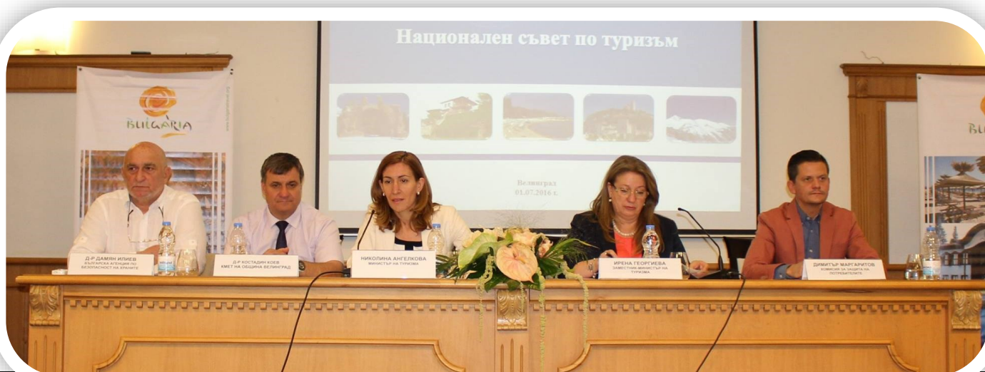
Снимка от изнесеното заседание на Националния съвет по туризъм във Велинград